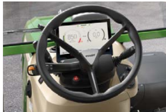
Tableau de bord – Console de commande – Terminal 12" – Touches librement configurables

Réglages et vue d'ensemble sur le tableau de bord Au centre du tableau de bord, vous pouvez faire défiler facilement les informations relatives aux différents groupes de fonctions. Les informations concernant la conduite sont affichées en permanence à gauche et à droite. Dans les versions sans terminal 12", vous pouvez contrôler facilement les paramètres des groupes principaux au centre : relevages, système hydraulique, moteur et transmission, ordinateur de bord avec affichage de la consommation, ventilation, éclairage, suspension du pont avant, attribution des distributeurs, entretien et diagnostics. Il suffit de définir les réglages avec la nouvelle molette de navigation installée à droite de la colonne de direction. Vous avez ainsi accès aux zones d'affichage et aux divers menus. Un bouton-poussoir rotatif séparé est prévu pour la climatisation et la ventilation.