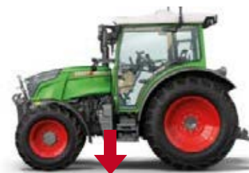
Fendt 211 Vario, 34 kg/ch

La compaction du sol provoque une réduction du rendement, notamment sur les terres arables et les pâturages. Les nombreuses options de pneus et le faible rapport poids/puissance du Fendt 200 Vario protègent vos sols. Avec ses 4280 kg ou 34 kg/ch, le Fendt 211 Vario est un vrai « poids plume ». Et bien sûr, vous pouvez le lester à votre convenance. Lors des manœuvres en bout de champ, admirez sa maniabilité exceptionnelle grâce à son rayon de braquage min. de 4,2 mètres.